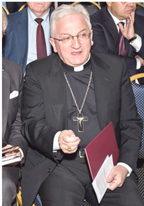
O Arcebispo Celestino Migliore, foi representante católico do Papa Francisco para esta celebração do aniversário do 500º aniversário da Reforma Protestante.

Então, 500 anos depois, Roma está a dizer às pessoas que Lutero, apesar de tudo, estava certo? Em