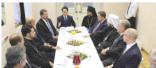
Um panorama da mesa-redonda ecuménica.