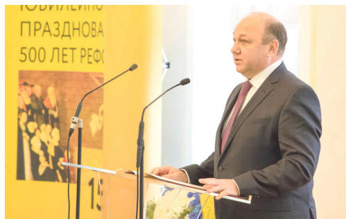
Chefe do Departamento de Política Nacional e Relações Inter-Regionais de Moscovo, Vitaly Suchkov.