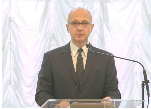
Primeiro Chefe Adjunto da Administração Presidencial da Federação Russa, Sergey Kirienko, braço direito do Presidente Putin.

Entre os discursos dos diferentes oradores, um coro composto por adventistas do sétimo dia das diferentes igrejas ao redor de Moscovo tocou músicas do livro dos Salmos. Para o seu grande final, o coro adventista cantou uma das peças mais bonitas da música cristã já escrita.