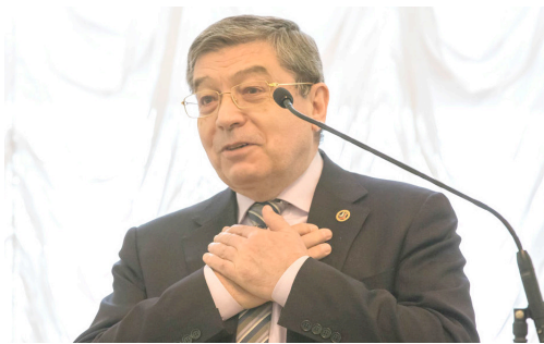
Iosif Diskin, presidente da Comissão de Harmonização das Relações Inter-Étnicas e Inter-Religiosas do Governo russo.