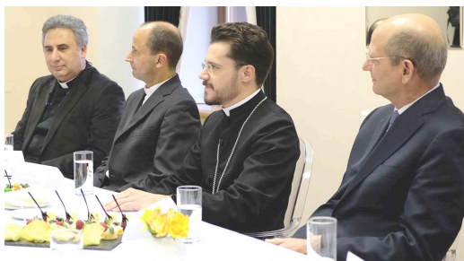
Comendo com Católicos e Evangélicos.