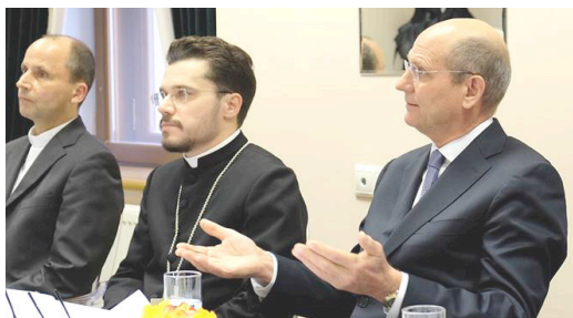
Wilson envolvido na comunhão interconfessional.